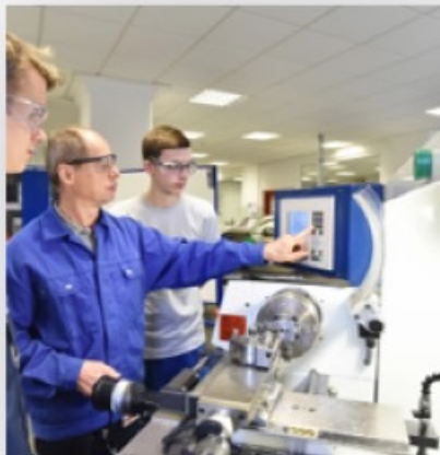
Стажировки на рабочем месте