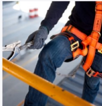
Обучения использованию средств индивидуальной защиты