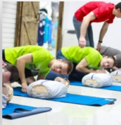
Обучения оказанию первой помощи пострадавшим