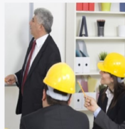
Обучения по охране труда