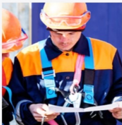
Инструктажей по охране труда

Новой редакцией статьи, устанавливающей требования к обучению работников, вводится понятие «обучение по охране труда», а также уточняется , что получение знаний, умений и навыков в области охраны труда осуществляется в ходе проведения: